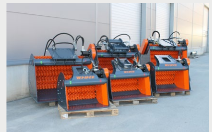
Sikteskuffer på 6 størrelser, 3-30 tonn

Innfelt: Lindner Jupiter utstyrt med FPS system for varmedeteksjon og vannkjøling.